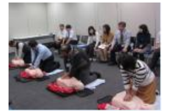
救命講習・応急救護実技訓練